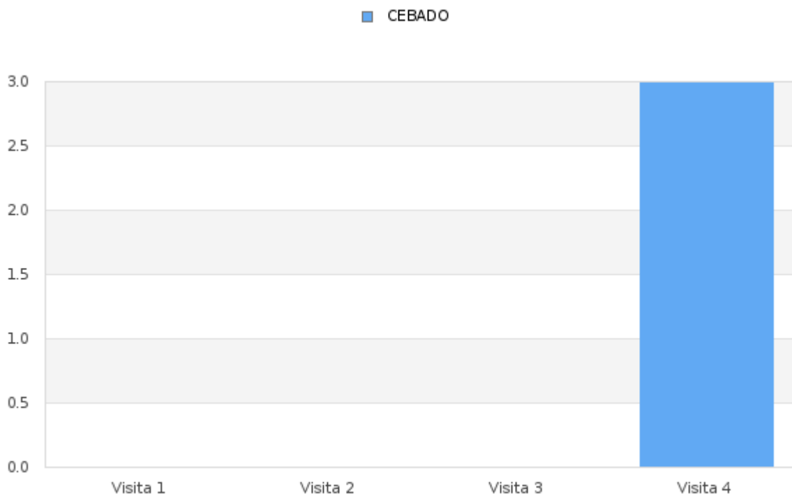
Tabla # 2 Porcentaje del Índice de infestación de roedores (estaciones de cebadero) de Enero - Diciembre 2025