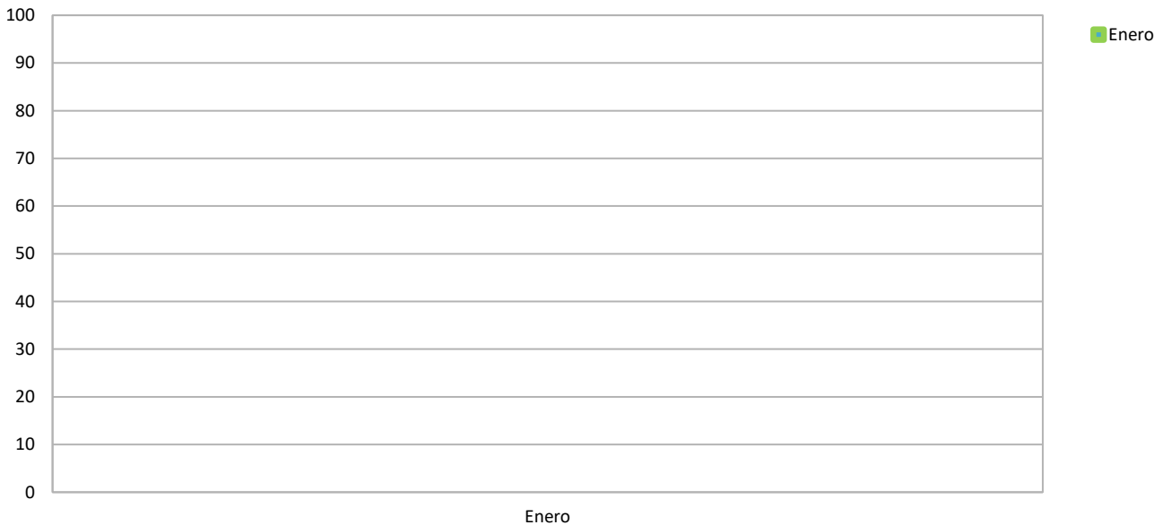
Gráfica # 3 Incidencia de Plagas (estaciones de monitoreo) de Enero – Diciembre 2023