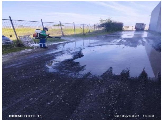
Desistimiento ulv en exteriores