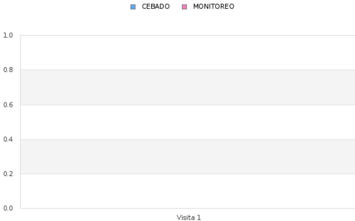
Tabla # 2 Porcentaje del Índice de infestación de roedores (estaciones de cebadero) de Enero - Diciembre 2024