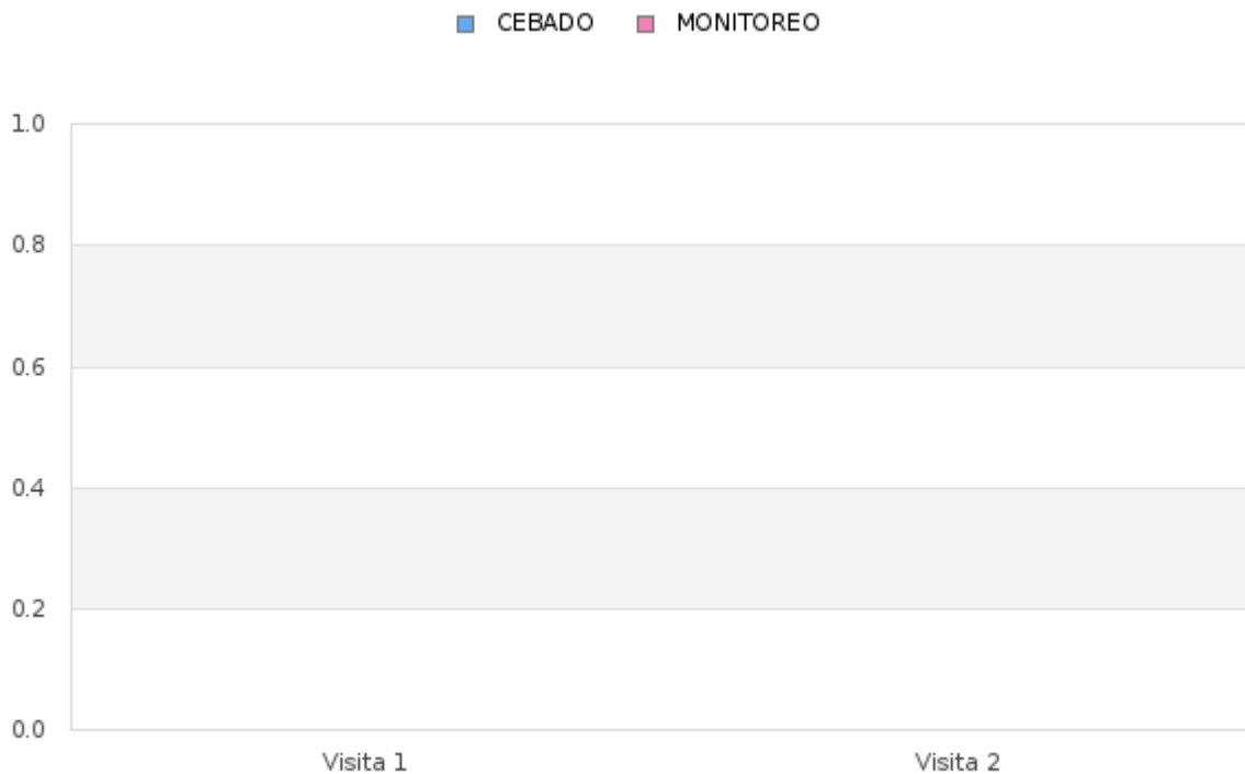
Tabla # 2 Porcentaje del Índice de infestación de roedores (estaciones de cebadero) de Enero - Diciembre 2024