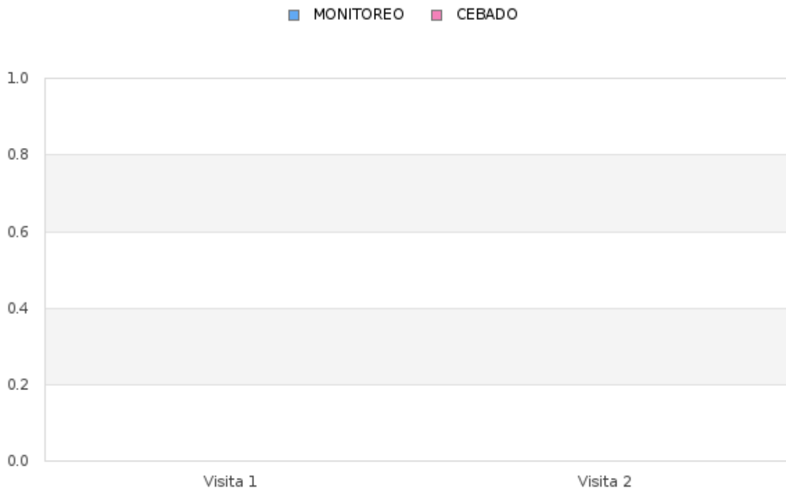
Tabla # 2 Porcentaje del Índice de infestación de roedores (estaciones de cebadero) de Enero - Diciembre 2024