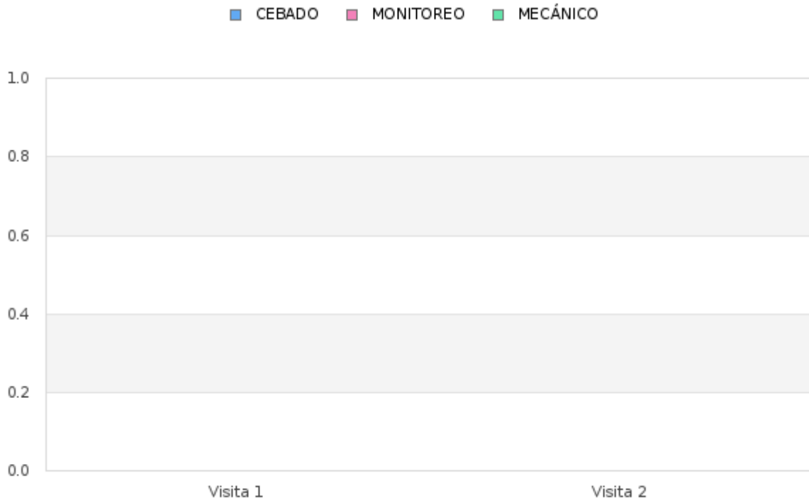
Tabla # 2 Porcentaje del Índice de infestación de roedores (estaciones de cebadero) de Enero - Diciembre 2024