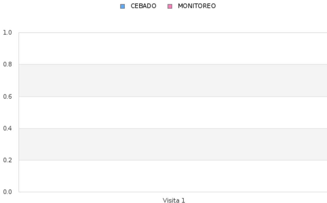
Tabla # 2 Porcentaje del Índice de infestación de roedores (estaciones de cebadero) de Enero - Diciembre 2024