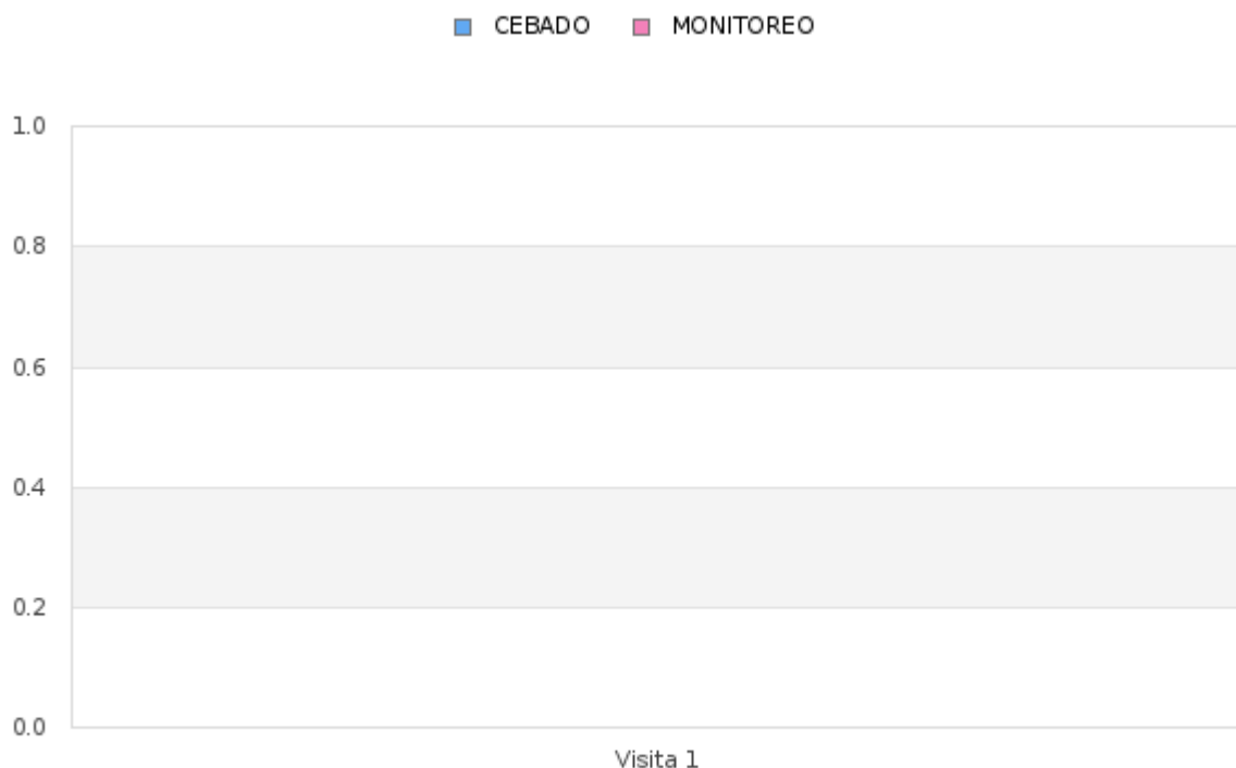
Tabla # 2 Porcentaje del Índice de infestación de roedores (estaciones de cebadero) de Enero - Diciembre 2024