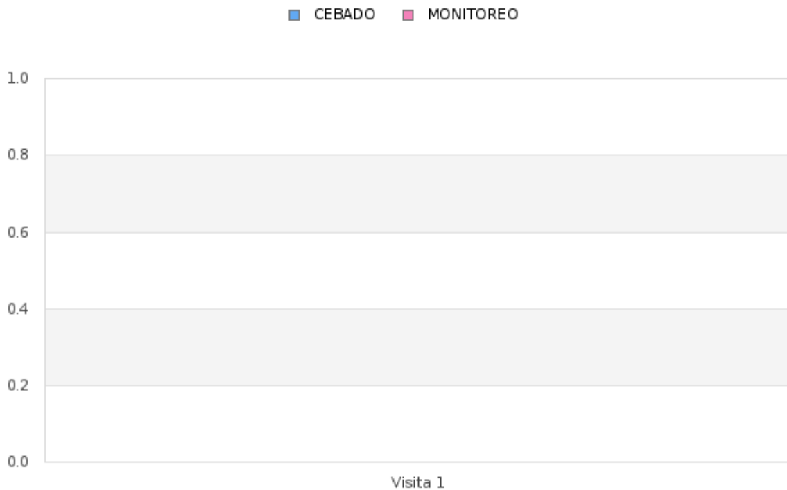
Tabla # 2 Porcentaje del Índice de infestación de roedores (estaciones de cebadero) de Enero - Diciembre 2025